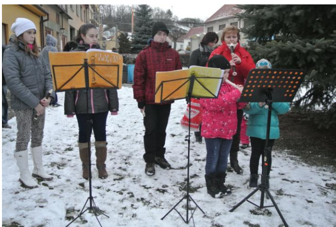
Několik fotografií z rozsvěcování letonického vánočního stromu ze dne 7. 12. 2013