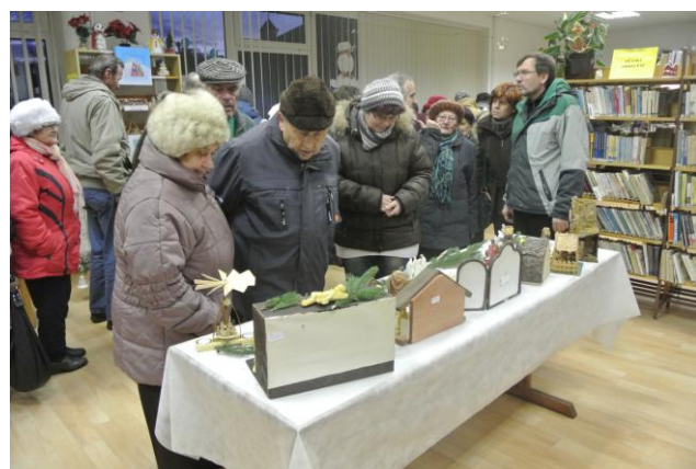
Výstava betlémů v letonické knihovně