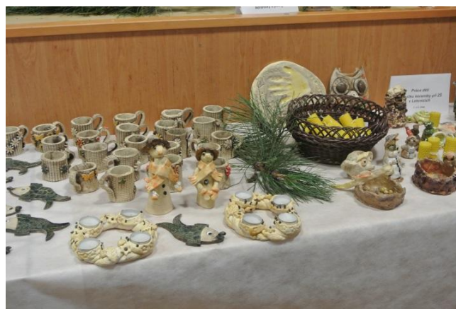
Práce našich dětí v keramickém kroužku