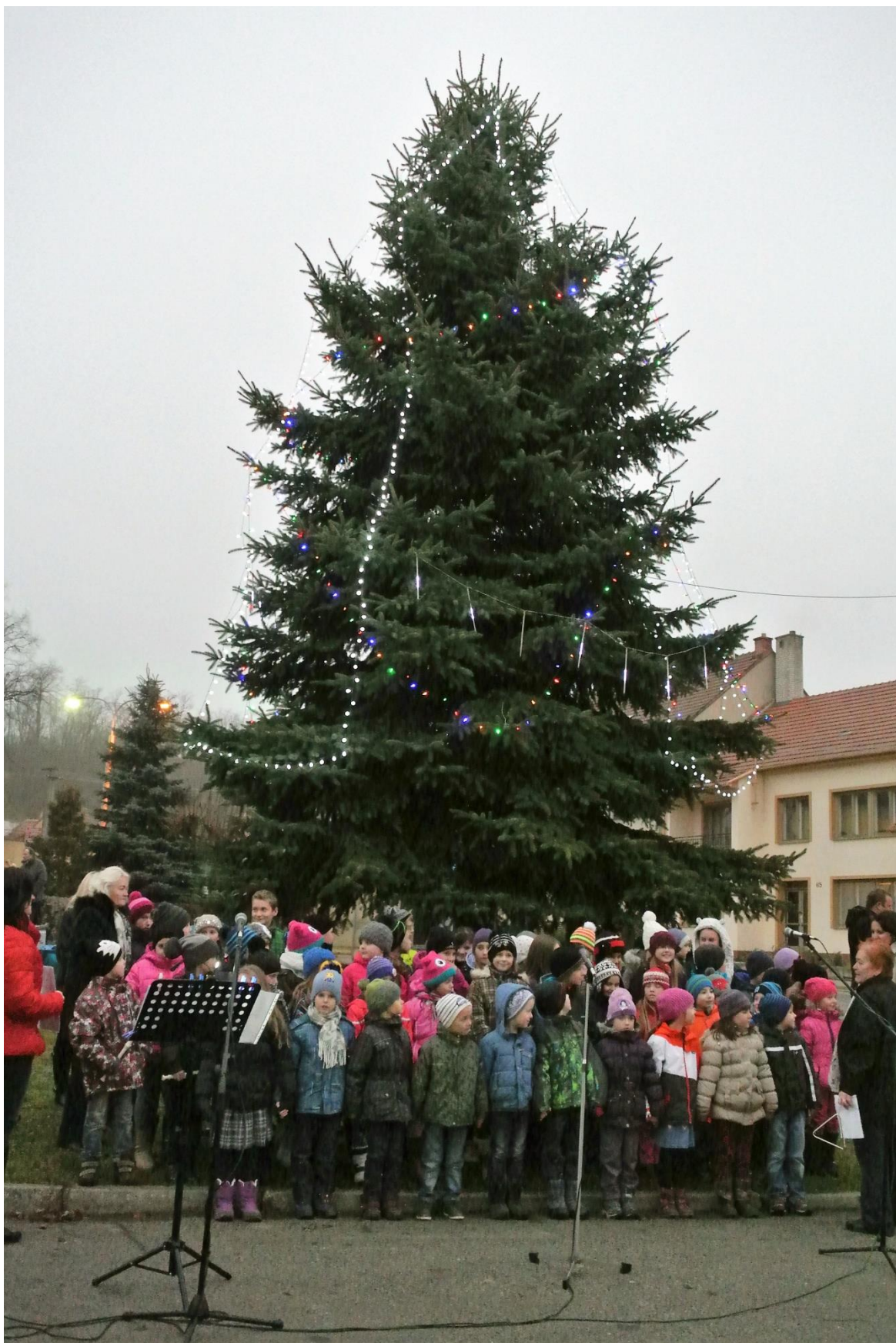
Z rozvěcování vánočního stromu v Letonicích