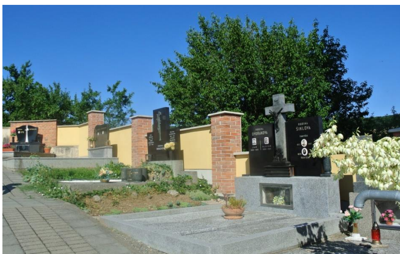
Opravená zídka na letonickém hřbitově