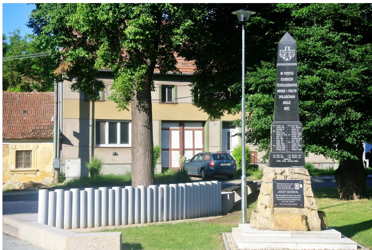
Nové úpravy v okolí Pomníku padlých