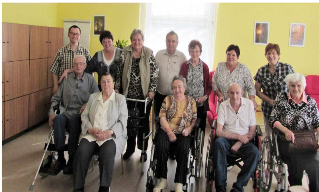
Představitelé obce a společenských organizací navštívili naše spoluobčany v Domě sociálních služeb ve Vyškově - Brňanech