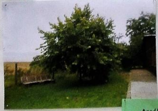
Areál – cihelna