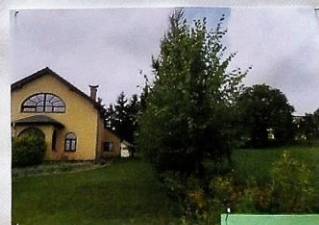
Zahrada Luďka Skokana