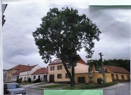
U obecního úřadu