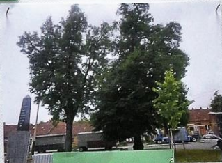
Park – náves