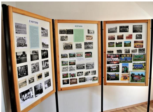
Výstava ke 100. výročí založení TJ

V neděli 30. 6. 2019 jsme společně oslavili 100. výročí založení tělovýchovy v Letonicích.