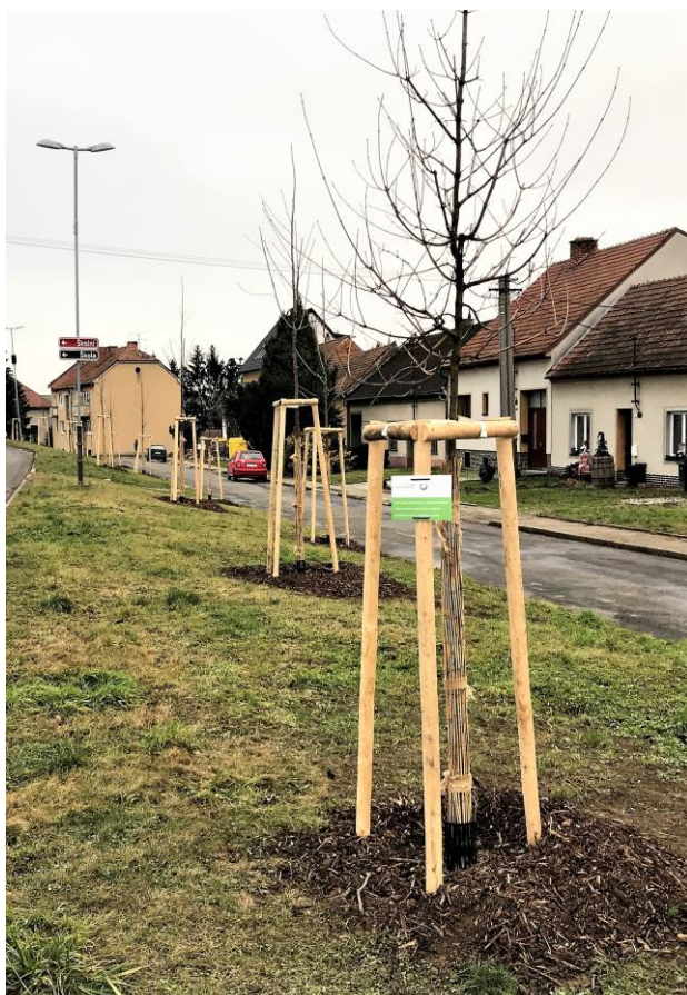
Nová výsadba stromů v ulici Družstevní